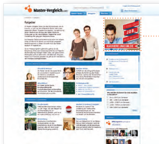
Medium Rectangle (300x250) Unterseiten