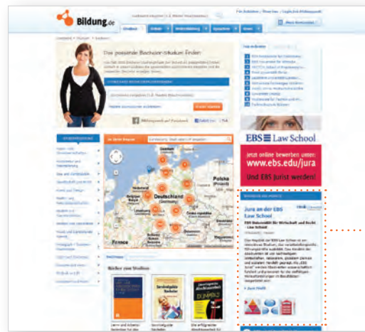
Anbieter/Programm des Monats Start- und Unterseiten