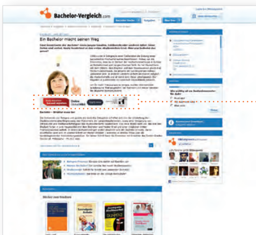
Fullsize Banner (468x60) Unterseiten