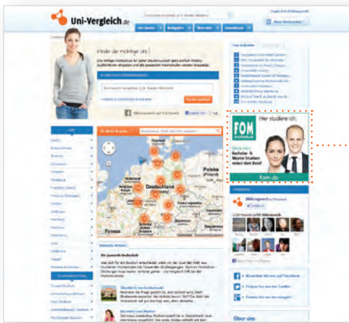
Medium Rectangle (300x250) Startseite